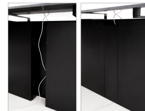
встроенный кабель-канал в панель-опоре, скрытый съемной панелью на магнитах